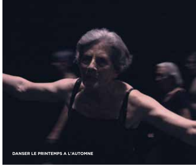
DANSER LE PRINTEMPS A L'AUTOMNE