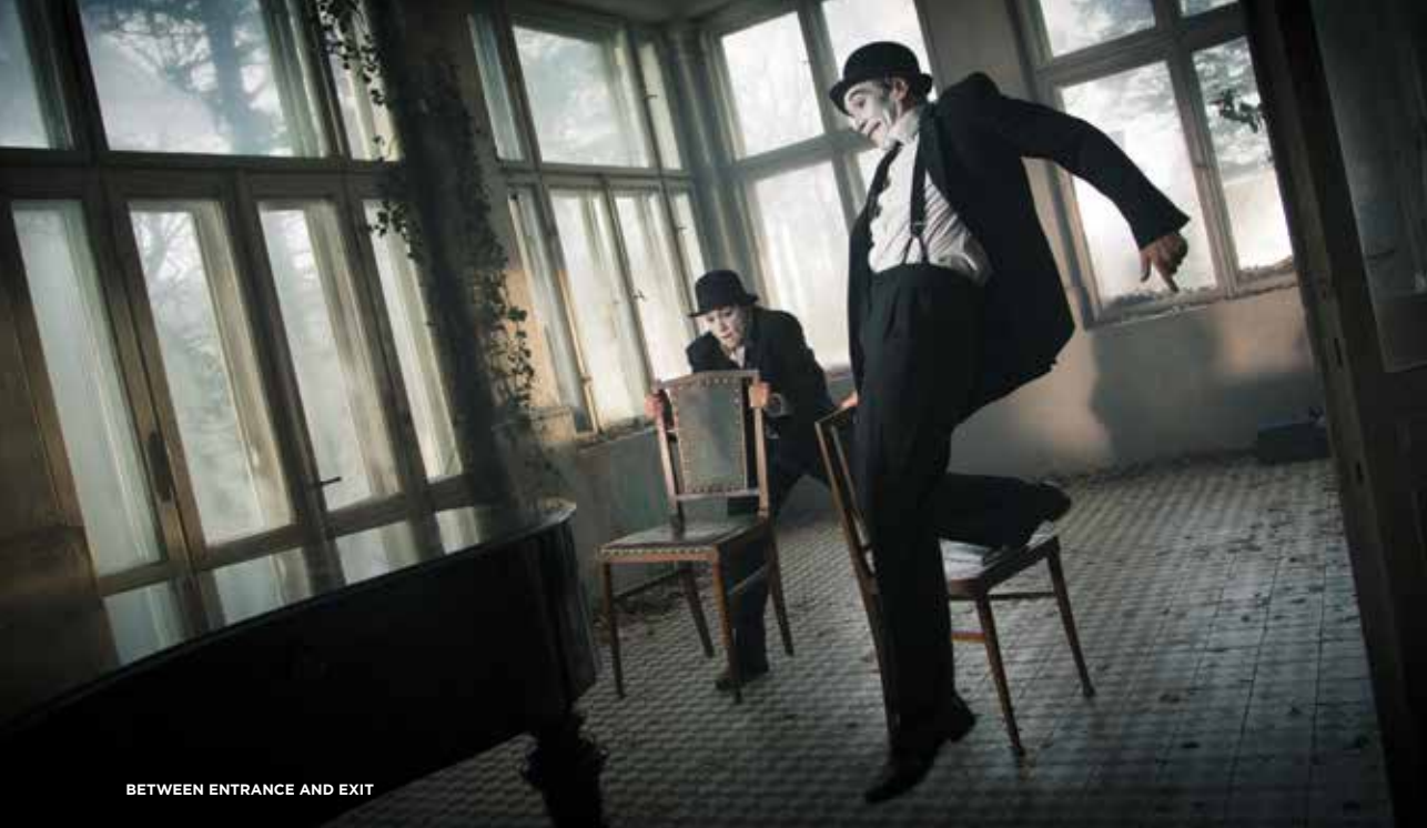
BETWEEN ENTRANCE AND EXIT